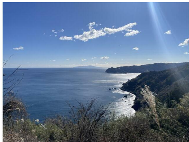
オーシャンビュー