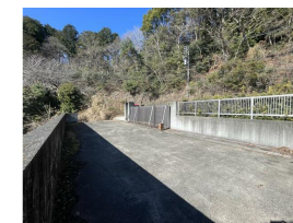
シャッター内は複数台の車両が停められるスペース