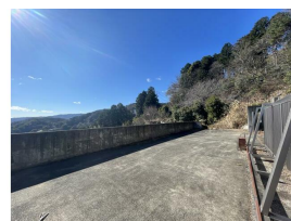
この先よりスロープで降ります