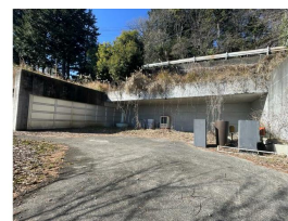
ガレージにも倉庫にも使えるシャッター付き建物あり