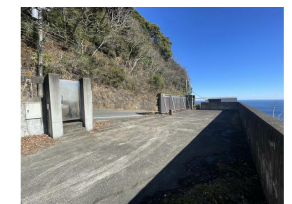
シャッター内の反対側から